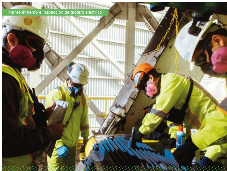
Mantenimiento e inspección de tablero eléctrico

En la actualidad, los servicios de mantenimiento industrial se orientan en la mantención de las principales centrales termoeléctricas del país y mantenimiento de puertos mecanizados, incluyendo sistemas de transporte y alimentación de silos para graneles sólidos, sistemas de distribución y almacenamiento de ácido sulfúrico, sistemas de manejo de residuos de combustión, plantas desaladoras de agua, grúas e infraestructura portuaria. Todo lo anterior, en las especialidades mecánica, eléctrica e instrumentación.